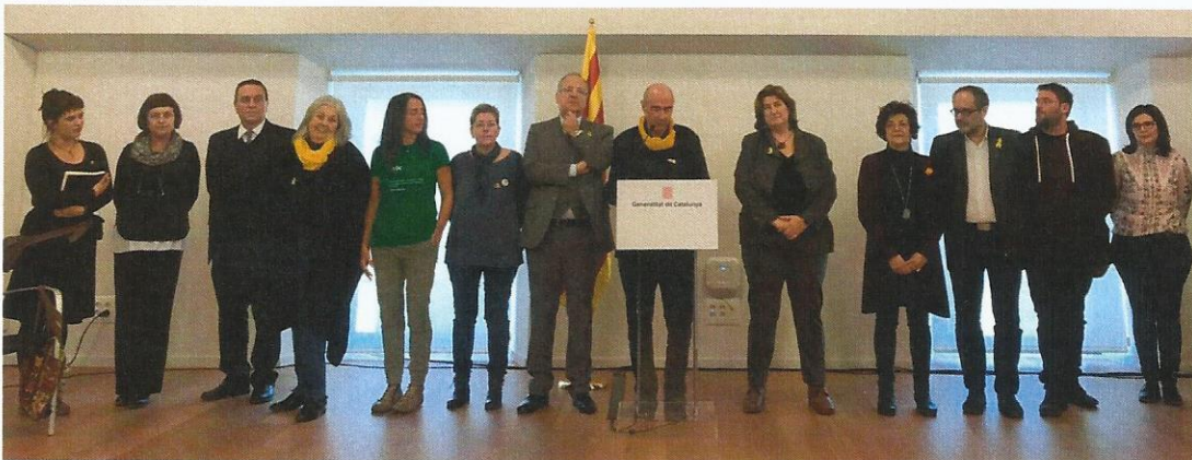
Acte de presentació del Consell Assessor del 8 de febrer de 2019

Té la tasca d'impulsar el debat implicant-hi el conjunt de la ciutadania. Proposa i orienta el debat tot col·laborant amb la societat civil per al seu desenvolupament. El Consell Assessor garantirà l'accessibilitat de tota la ciutadania als debats així com la seva transparència. Impulsarà la conformació de l'Entesa Nacional per al Debat Constituent i el Fòrum Cívic i Social que canalitzarà les opinions expressades a través dels debats.